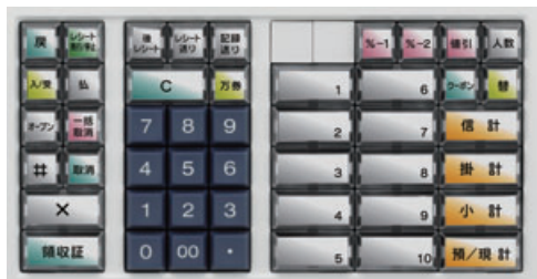
10部門タイプ(ピュアホワイト)

キーボードには使いやすく美しいユニバーサルデザインカラーを採用。おしゃれなデザインでお店の雰囲気づくりにも役立ちます。