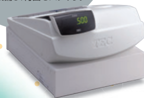
5部門タイプ MA-500-5 (ピュアホワイト)

●あざやかなホワイトカラーが 店内のイメージを明るく演出。 ●大型LEDお客様表示器を 標準装備し、背面もスッキリ。