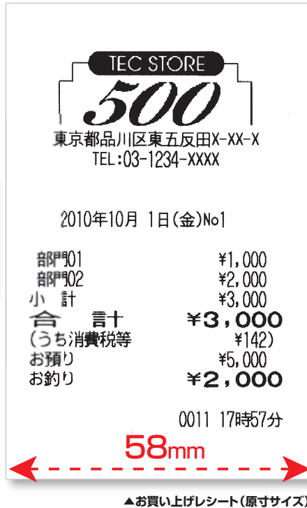
▲お買い上げレシート(原寸サイズ)

eco スタイル ※東芝テックは製品のライフサイクル(部品、部材調達→製造プロセス→流通→お客様の使用→使用済製品のリサイクル)について開発・設計段階より環境設計アセスメントを実施しています。また、東芝テック独自の環境調和型製品の基準を定め、この基準を満たした製品には左記マークを表示しています。詳しくは東芝テック リテールソリューションのホームページをご覧ください。