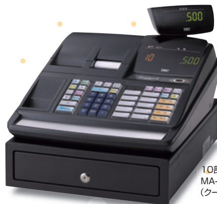
10部門タイプ MA-500-10B (クールブラック)